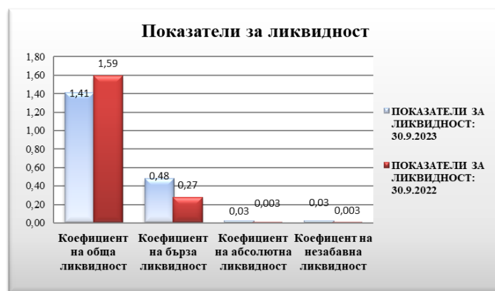
Таблица № 2